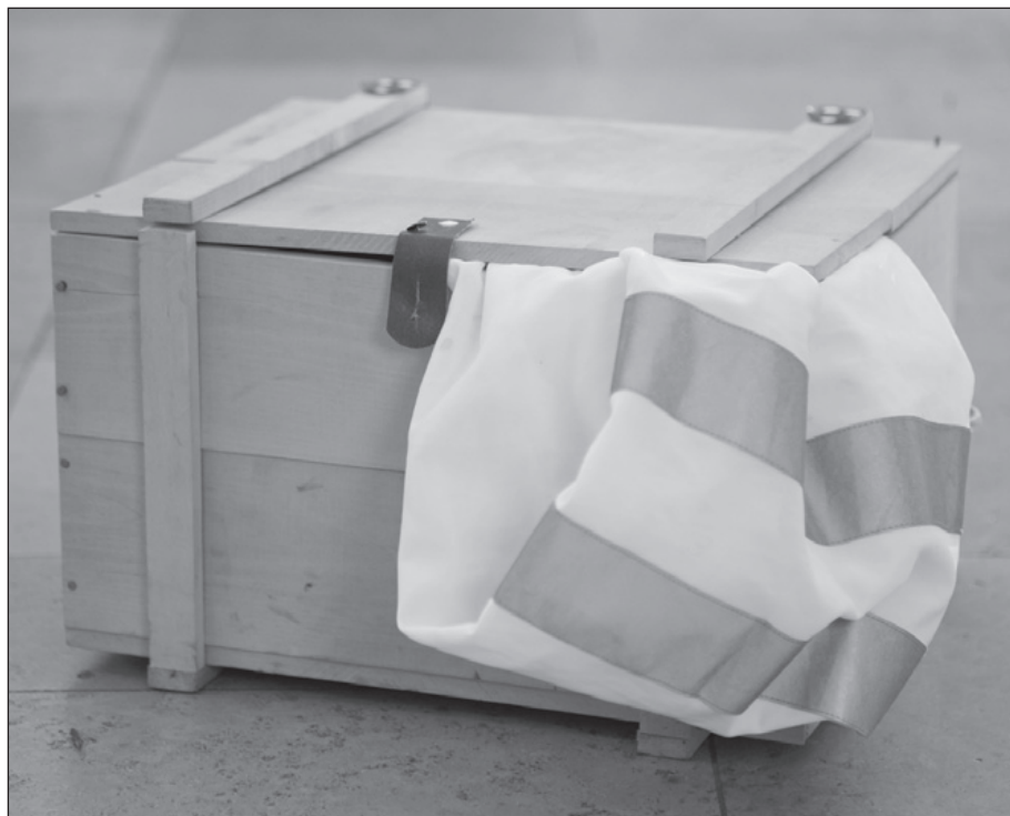
Manchmal sind junge Menschen auf Hilfe von Erwachsenen angewiesen. Davon zeugt dieses Erinnerungsstück in der Schatzkiste eines kleinen Jungen. Bei einem Autounfall bekam er Hilfe von einem fremden Mann, der ihm als Erinnerung an den glücklichen Ausgang seine Warnweste überließ (aus unserer DIALOGBEREIT-Ausstellung).

Einen Sonderfall stellt die Bipolare Störung dar (manisch-depressive Erkrankung), die ebenfalls im Kindes- und Jugendalter oft unerkannt auftritt, da ihre Symptomatik zunächst unspezifisch ist. Hier treffen depressive Symptome mit Vorläufern von hypomanischen und manischen Phasen aufeinander. Diese sind im Kindes- und Jugendalter nicht wie typischerweise im Erwachsenenalter mit einem für jeden wahrnehmbaren Hochgefühl und Selbstüberschätzung und „offensichtlich verrückten Verhaltensweisen“ erkennbar, sondern teilweise nur in gereizt dysphorischer Stimmungslage, Schlafstörungen, ungezielter Antriebsstei-