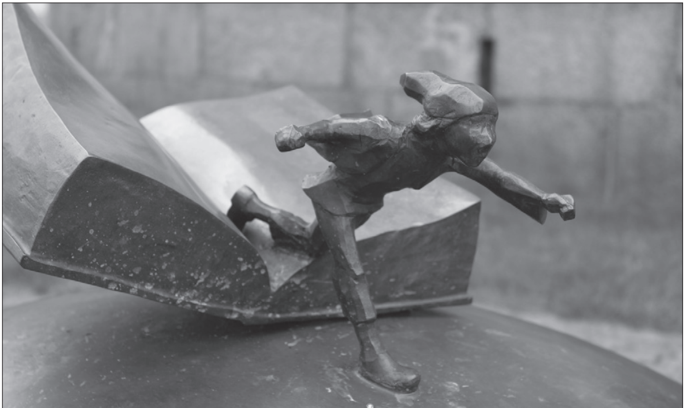
Die Heldenfiguren aus Geschichten und Märchen sind für Kinder oft sehr real und können bei der Bewältigung von Entwicklungsaufgaben unterstützen.