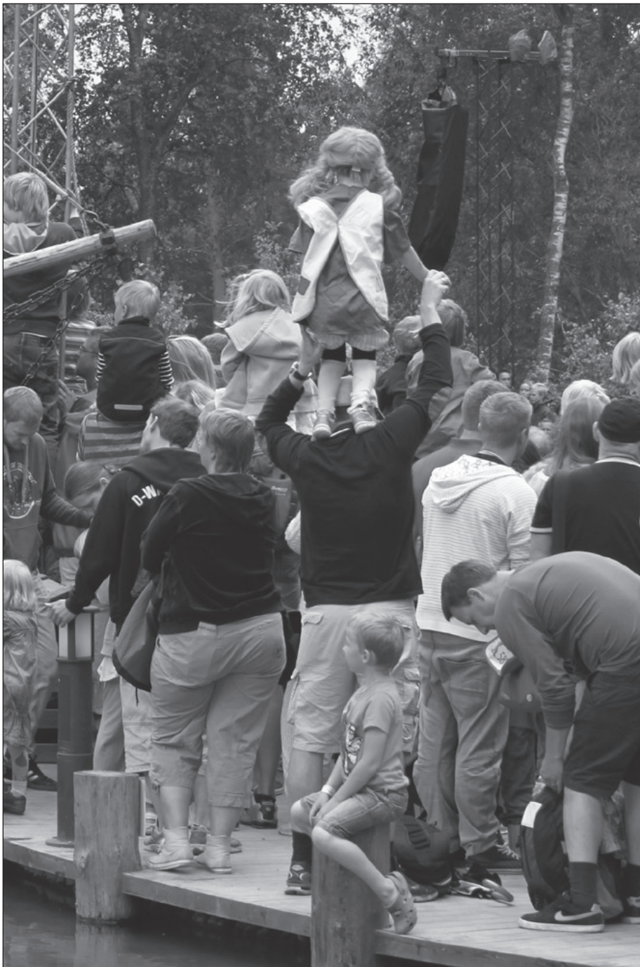
Starke Schultern und freche Vorbilder können dabei helfen, größer zu werden und (über sich hinaus) zu wachsen.

tem Gesicht und umgeben von Passagieren mit Monsterfratzen, auf den mit scharfen Zähnen besetzten ‚Schlund‘ der Bahn zu. Die KJM entschied, dass der Spot für jüngere Kinder unter 12 Jahren aufgrund der Bilder und des schnellen Schnitttempos eine beeinträchtigende Wirkung hat.“ (ebd.)